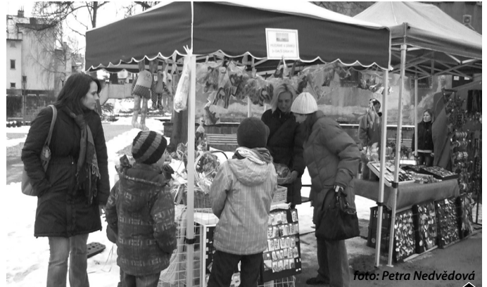
Trhy i přes chladné počasí nalákaly spoustu lidí.