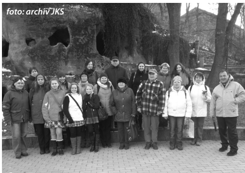
Jílovský komorní sbor v Mimoni.

Zimní spánek se týká zvířátek, zvláště jezevců. Ne však Jílovského komorního sboru. Po adventních a vánočních koncertech jsme si nedopřáli zimního odpočinku, ale s plnou vervou se pustili do nacvičování jarního repertoáru. V pilné práci jsme přečkali zimní slotu, předjarní plískanice a první jarní sluníčko nás nezaskočilo nepřipraveně. Zkouška se sešla se zkouškou, ani jsme se nenadáli a byl tu první jarní den.