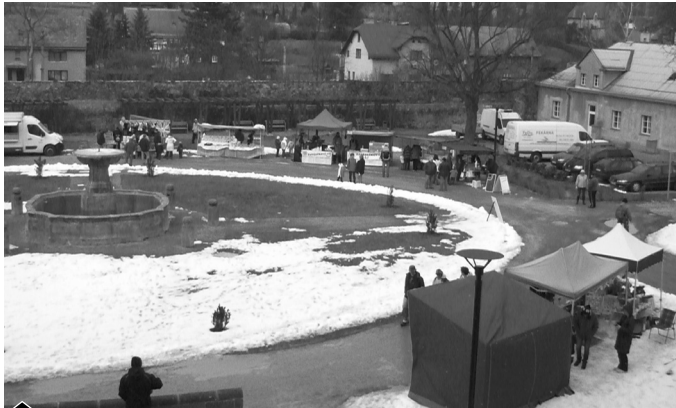
Stánky vyrostly na nádvoří Jílovského zámku.