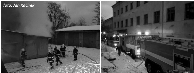
Hasiči JSDHO Jílové - Modrá při zásahu.

1. března 2013 byl v podvečerních hodinách na linku 150 ohlášen požár objektu bývalého skladu civilní obrany MV ČR v Jílovém. Na místo události vyjely jednotky HZS PS Děčín, SDH Jílové - Modrá, SDH Horní Žleb a SDH Libouchec. Po příjezdu na místo bylo zjištěno, že se jedná o požár přístřešku u plynové kotelny. Na likvidaci požáru byly nasazeny dva útočné proudy. Během krátké chvíle se podařilo dostat plameny pod kontrolu. Díky včasnému nahlášení a včasnému zásahu hasičů se požár nerozšířil na hlavní budovu objektu. Na místě kromě hasičských jednotek zasahovala také Policie ČR a Městská policie Jílové. Požár byl zlikvidován krátce před půl devátou. Příčina a škoda se vyšetřují. (O plánované koupi skladu CO se dočtete na stranách 2 a 5.)