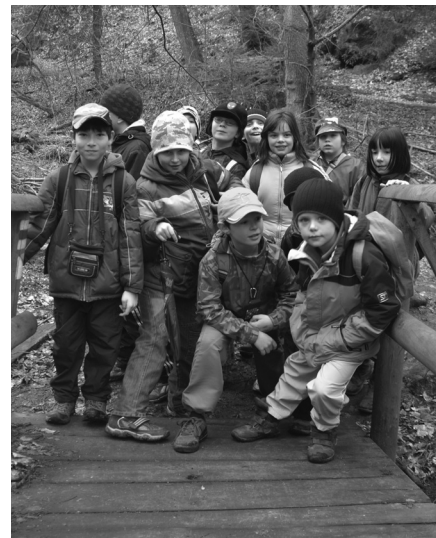
třídy 3.A a 3.B, foto a text: Heřman Žilík

bude možné, rádi bychom podobnou akci letos alespoň ještě jednou zopakovali.