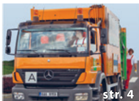
Jak nakládat s odpadem