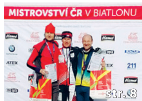
Biatlonová „Doba bronzová“