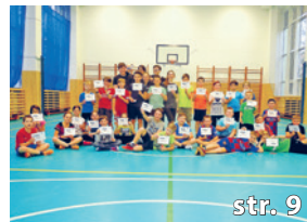
Turnaj ve vybíjeně