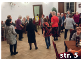
Jak jsme se pobavili