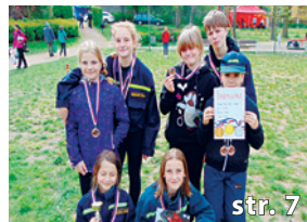
Putovní pohár města Jílové