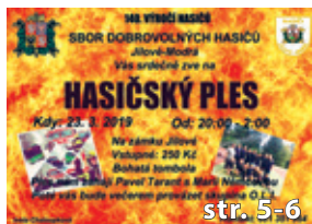
Pozvánky za kulturou