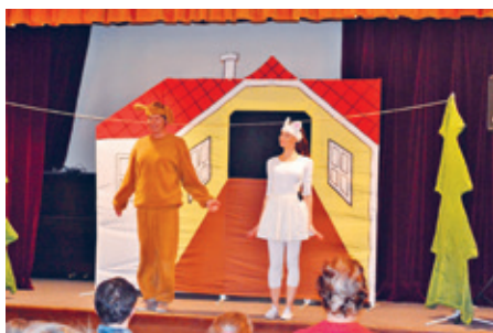
Nedělní pohádka 24. 2.