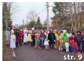
Masopust na Sněžníku