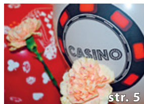
Ohlédnutí za plesem