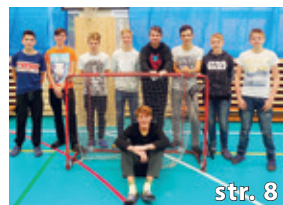
Florbalový turnaj škol