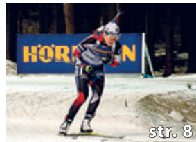
Z blátivých Vánoc do bílé stopy