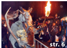
Ohlédnutí za prosincem