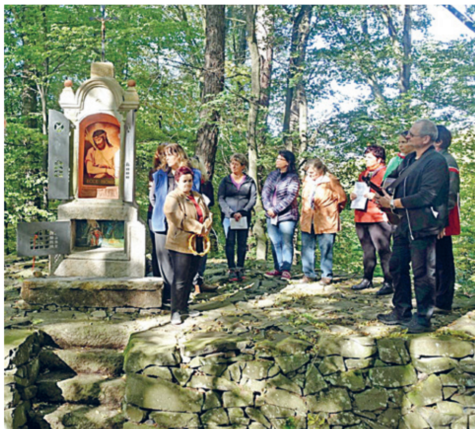
Poděkování patří Jílovskému pěveckému sboru, který při požehnání kapličky zapěl

(Převzato z Děčínských vlastivědných zpráv č. 1/2019, které lze zakoupit v děčínském muzeu.)