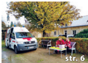
Běh pro Máru a Spajka