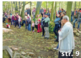
Setkání u kapličky