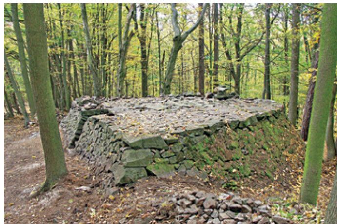
Mohyla upravená dobrovolníky v letech 2018-2019 je ještě bez kapličky