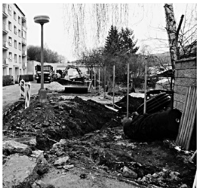
Výstavba parkovacích stání příjezdová komunikace Teplická čp. 2, 4 a 6

Projektant: ENVIPARTNER, s.r.o., Vídeňská 55, 639 00 Brno