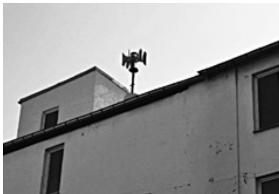
Siréna na budově papíren

Zároveň došlo na základě žádosti města Jílové k úpravě nastavení sirén pro svolávání členů JSDHO. Nově bude ke svolávání sloužit pouze elektronická siréna umístěna na objektu společnosti DS Smith Packaging Czech Republic, s.r.o. Ostatních 5 sirén a reproduktorů nebudou pro svolávání členů JSDHO sloužit. Pouze každou první středu v měsíci (tak jak je tomu v celé ČR) proběhne v 12.00 hod. zkouška sirén (přenášena i do reproduktorů). BMIS bude také sloužit ke zveřejňování dalších informací (například z oblasti kultury).