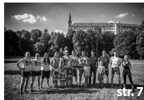
Bobo běh 2017