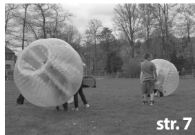
Jaro v Jílovém