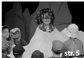
Elce Pelce 2017