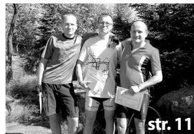
Cyklistický „orkán“ potřetí