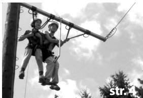
Adrenalin pro náctileté...