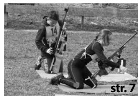
Nastává čas další přípravy

Kulturní kalendář na červen, vložené listy