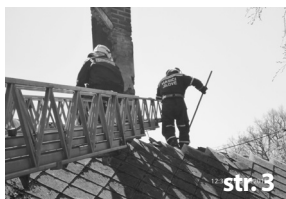
Události MP, JSDHO