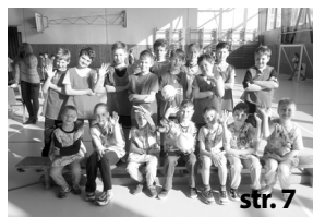
Školní liga v miniházené