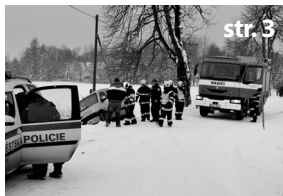
Události PČR, MP, JSDHO...