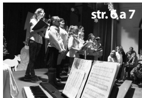
Ohlédnutí za adventem