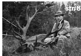
Letopisy s pětkou na konci

Kulturní kalendář na únor, jízdni řády vložený list